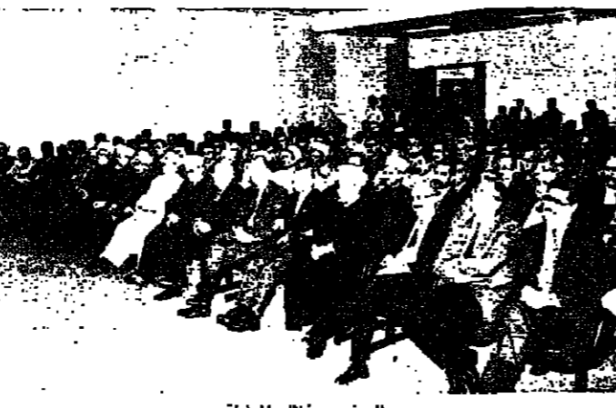
الحضور خلال المباراة